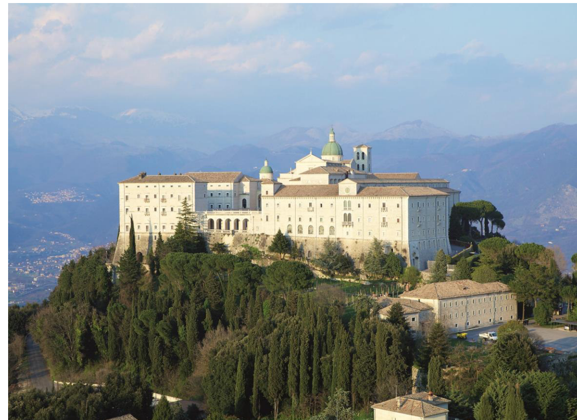
Benediktinerkloster von Montecassino

Die beigefügten Allgemeinen Reisebedingungen sind Bestandteil dieses Prospektes. Regelungen zum Rücktritt vor Reiseantritt: siehe Ziffern 6 & 7 (Stornobedingungen Ziffer 7.1)